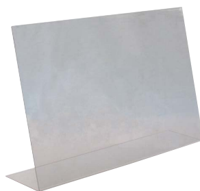
04| 75 x 18 cm | H 48 cm ohne Öffnung no. 98003 49,00 €