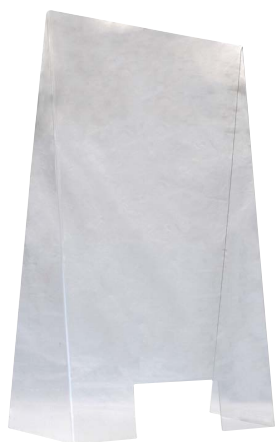
01| 60 x 28 cm | H 99 cm Öffnung 25 x 12 cm no. 98000 89,00 €

Der Spuckschutz kann auf der Theke, den Tresen oder an der Kasse aufgestellt werden. Egal ob der Spuckschutz in der Apotheke, Arztpraxis, Bäckerei, Kiosk, Tankstelle, Behörden und Ämtern oder anderen Geschäften benötigt wird.