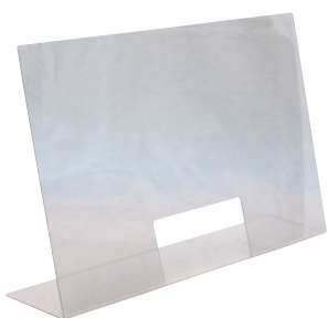
03| 75 x 18 cm | H 48 cm Öffnung 25 x 12 cm no. 98002 54,00 €